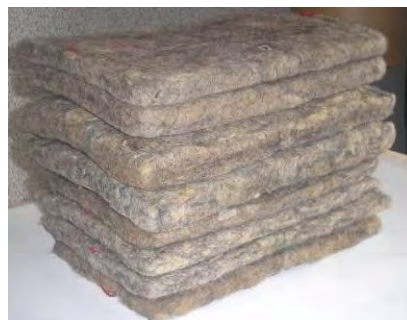
а) вихідна сировина