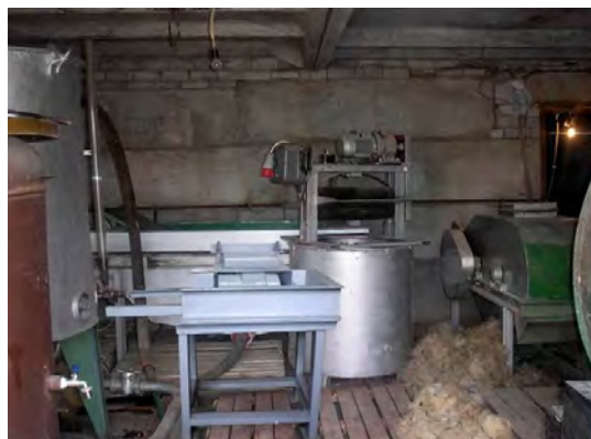
а) машина тріпальна МТ-001А-12