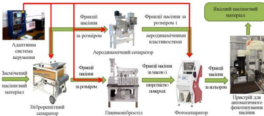
Рис. 2. Розроблена раціональна прецизійна технологічна лінія процесів сепарації насіннєвого матеріалу соняшника